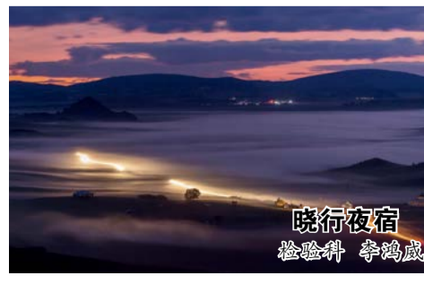
晓行夜宿 检验科 李鸿威