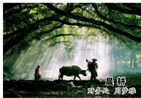
晨耕 财务处 周梦雅