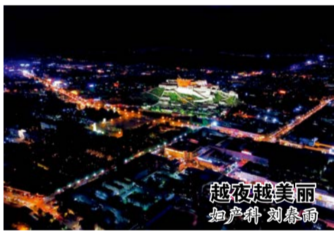
越夜越美丽 妇产科 刘春雨