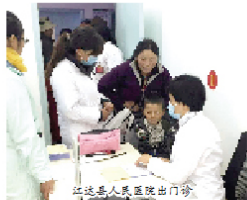
江达县人民医院出门诊