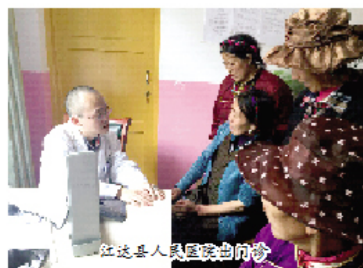
江达县人民医院出门诊