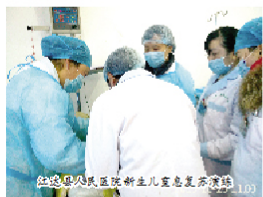
江达县人民医院新生儿室复苏演练