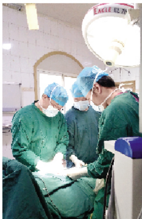
昌都地区人民医院首例腹腔镜下胆总管探查术