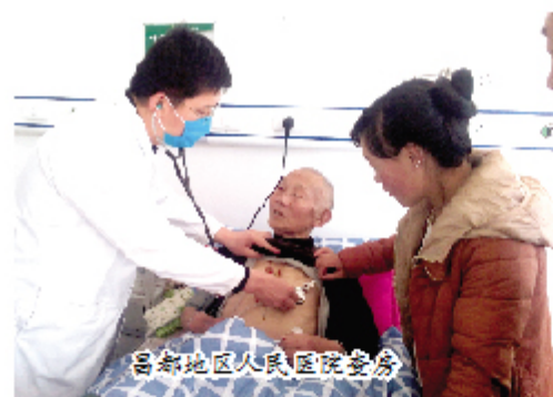
昌都地区人民医院查房