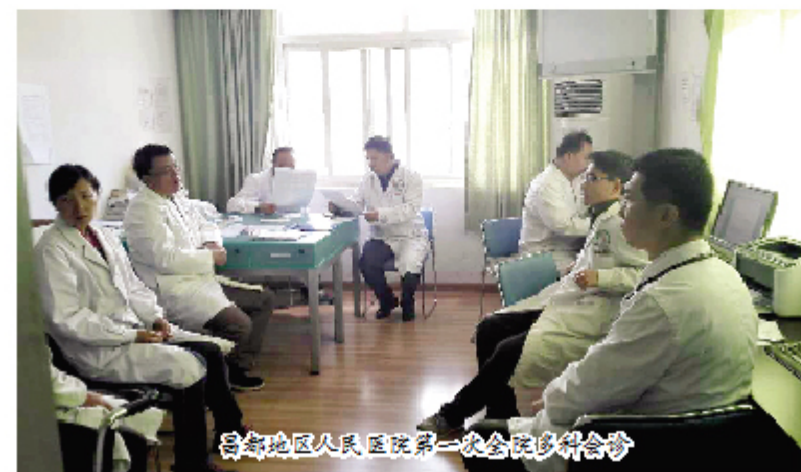
昌都地区人民医院第一次全院多学科会诊