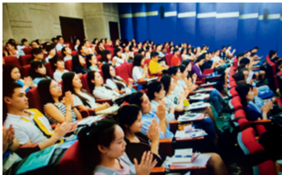
本报讯 8 月 1 日，我院 2016 年新员工入职及岗前培训工作启动，共有 129 名应届毕业生顺利来到