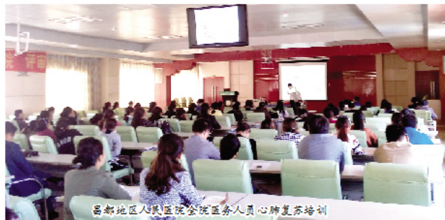
昌都地区人民医院全院医务人员心肺复苏培训