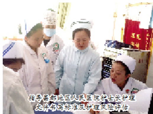
指导昌都地区人民医院护士长护理 交待书写标准及护理风险评估