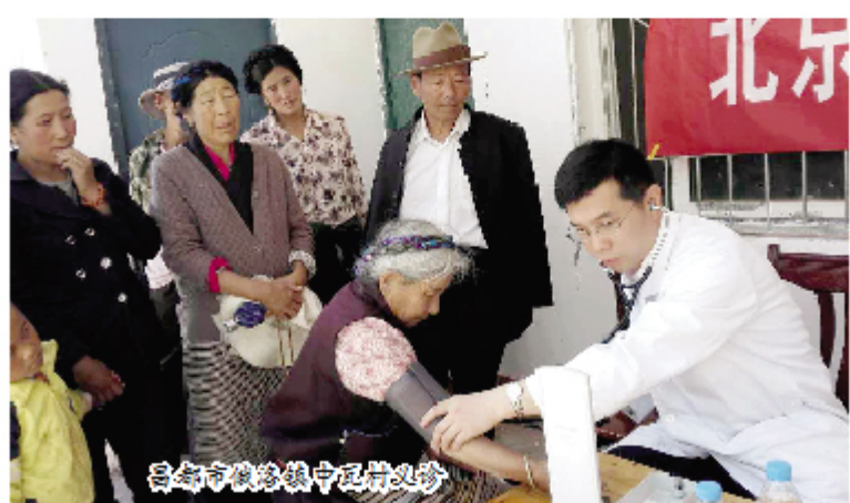
昌都市俄洛镇中泥村义诊