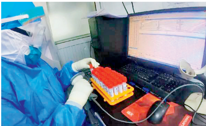
样本接收区的工作人员正在一丝不苟的核对新冠核酸检测样本的条码信息，并录入电脑lis系统。

2020年1月25日，大年初一，取消休假的相关临床科室和职能处室干部开始忙碌起来。