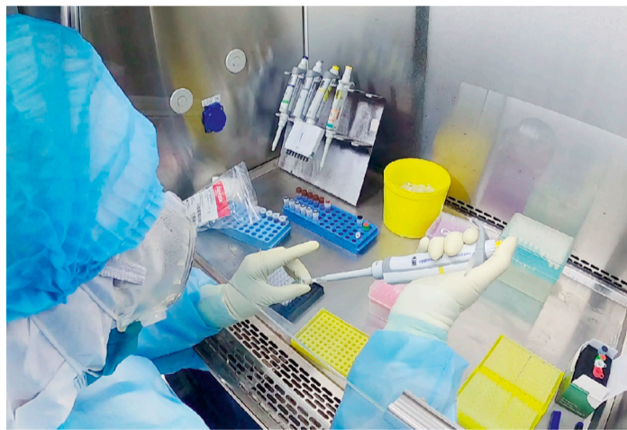
工作人员正在安全柜里分装PCR反应所需要的扩增试剂。

共卫生应急响应级别由二级调整为三级。疫情防控成效来之不易。自6月11日北京突发确诊病例至今,一个多月的“战时状态”,北医三院快速反应、主动出击,在原有筛查渠道的基础上,通过多次腾挪改造,开辟出“发热病人”、“住院患者”、“愿