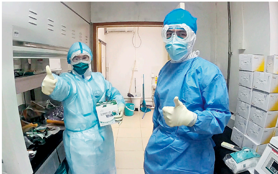
工作人员已经穿戴好防护用品，带着实验所需的耗材即将进入样本制备区，为接下来的新冠核酸检测实验做好准备。

在新冠肺炎疫情防控初期，在满足医院正常运转的前提下，检验科分子生物实验室的工作人员共有4位，每两人一组。每当国家更新关于新冠病毒核酸