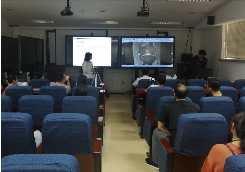
科室每月举行主治医师教学查房，主治医师带领住院医师进行临床典型病例分析。