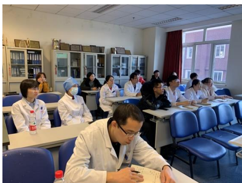
住院医师理论培训