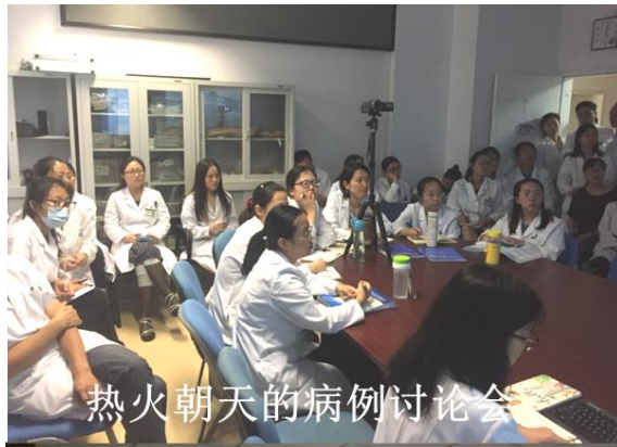
热火朝天的病例讨论会