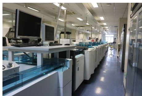
Roche Cobas 全自动样品处理系统