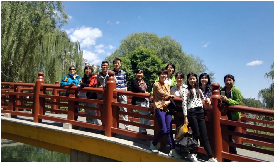
住院医师积极参与科室活动