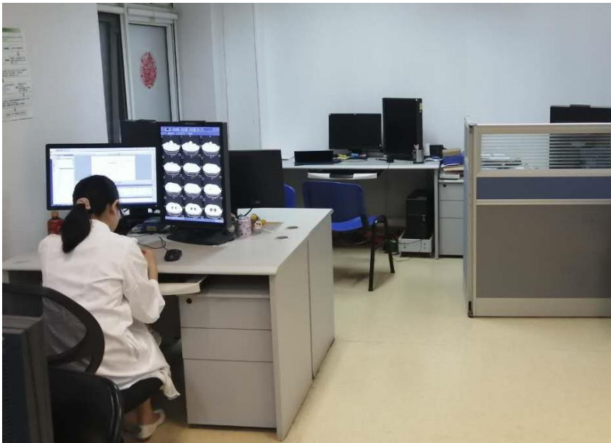
整洁的阅片诊断室。