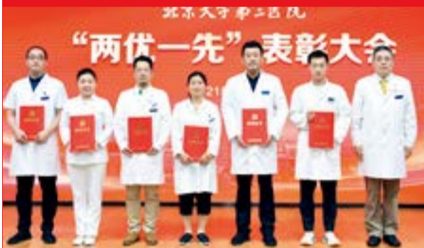
北京大学第三医院先进党组织代表