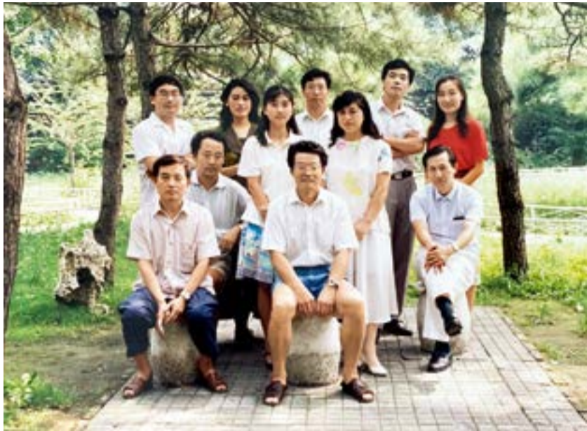
1993年北医三院教学办公室工作人员合影

这张老照片拍摄于1993年夏天北医三院老病房楼前的花园，里面的人物是北医三院教育处“四轨合一”之前教学办公室全体工作人员。在记忆中永存的是三院建院的标志性建筑：工字形的老病房楼，楼前郁郁葱葱的花园里，两棵遮天蔽日的高大梧桐树见证着三院人前赴后继的历史；花园正中是前辈挖出的喷水池，从喷水池中央鱼嘴喷出的花柱吸引着散步的病人聚集在池边，搜寻着池中游弋的小鱼；春机盎然的花园墙边，还能采摘到几个野生的草莓。