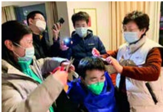
乔杰院士为援鄂队员理发

震撼是因为，理发师不是别人，是乔杰院长。像一位慈祥的母亲，在为临行前的孩子打点。