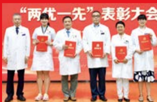
“牢记初心使命 书写时代芳华”征文活动 一等奖