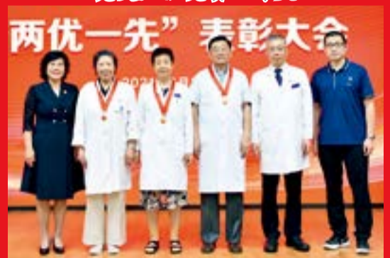
光荣在党 50 年代表