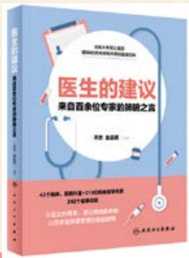
《医生的建议——来自百余位专家的肺腑之言》书籍封面

本报讯 为扎实推进党史学习教育走深走实，以深学促实干，北医三院积极开展“我为群众办实事”实践活动，日前，由北医三院组织编写、人民卫生出