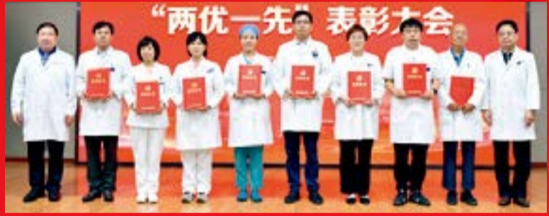
北京大学第三医院优秀党务工作者代表