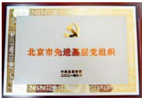
北京市先进基层党组织奖牌

本报讯 6月17日上午,北京市召开“三优一先”表彰大会,隆重表彰北京市优秀共产党员、优秀党务工作者、优秀基层党组织书记和先进基层党组织。