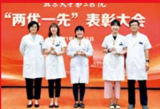
“擦亮北大红 共筑三院梦” 党史知识竞赛二等奖