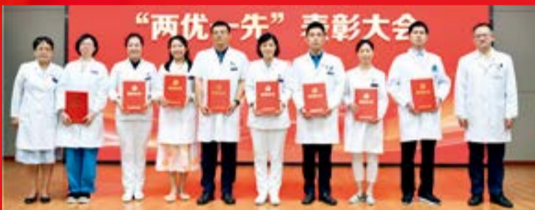
北京大学第三医院优秀共产党员代表