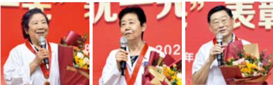
光荣在党50年党员代表在表彰大会上发言

本报讯 100年光辉历程，50年初心不改。在迎接建党100周年前夕，结合“光荣在党50年”纪念章的颁发工作，北医三院党委组织开展对老党员、老同志的走访慰问活动。