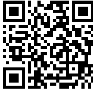
图 2 “每日现场办公打卡二维码”