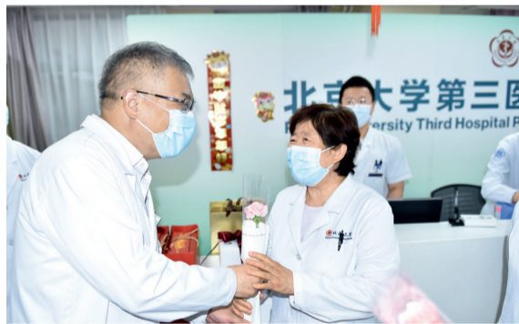
当天慰问我院医师