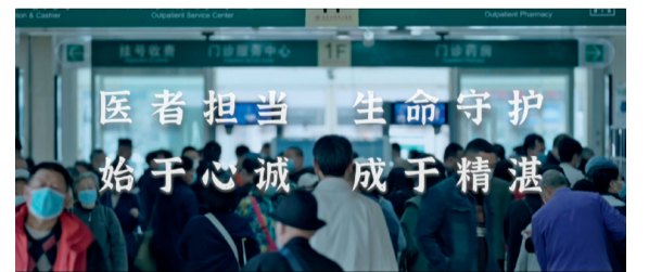
北大首部观察型行医纪录片《心外纪事》

感恩有你们，坚守在临床一线，为战胜疾病攻坚克难；感恩有你们，为一个家庭送去安慰与希望；感恩