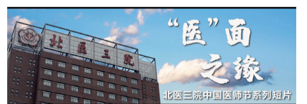
“医”面之缘——北医三院中国医师节系列短片

确定性，却十分温暖的故事。让更多人真切地感受到医者的人文情怀和责任担当，在医学与社会大众认知之间，在医者初心与患者信任之间，搭建起一座桥梁。