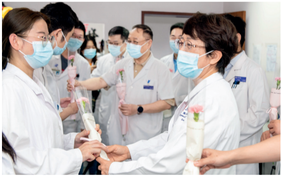
院领导在“医师节”当天慰问我院医师