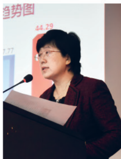
医院院长年年荣获中国最佳医院管理团队一群星璀璨奖;9个科室在北京大学发布的最佳临床学科评估结果中排行前15名。

全市二级以上DRGs排名我院位居榜首;复旦大学医院管理研究所专科排名TOP20新增四个学科;第九届中国