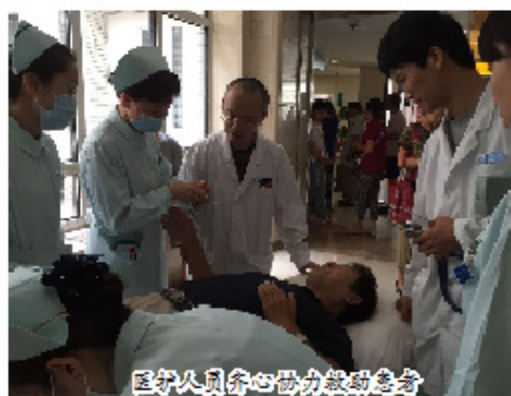
医护人员齐心协力救助患者