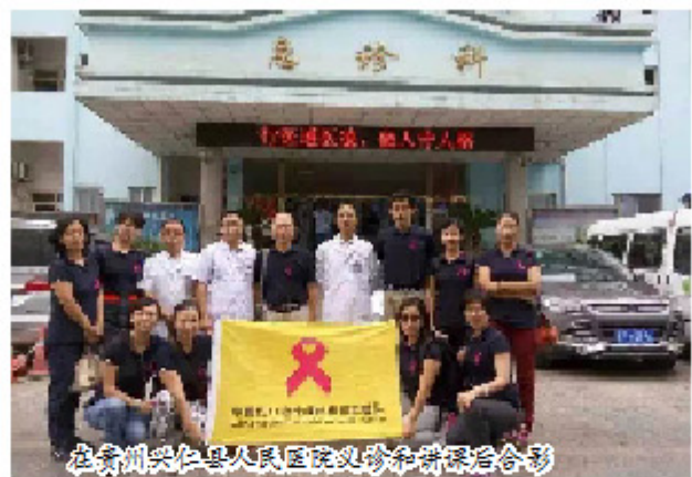
在贵州兴仁县人民医院义诊和捐赠合影