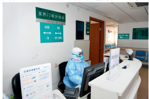
院内工作有序进行

同时，北医三院“北京防线”上，全院上下统筹协调，每日召开工作例会，不眠不休进行硬件改造，全面梳理相关就诊流程、诊疗规范等，多次进行全员培训，创造条件开展核酸检测，严格按照防控要求重新划分医疗空间布局。全院职工积极参与