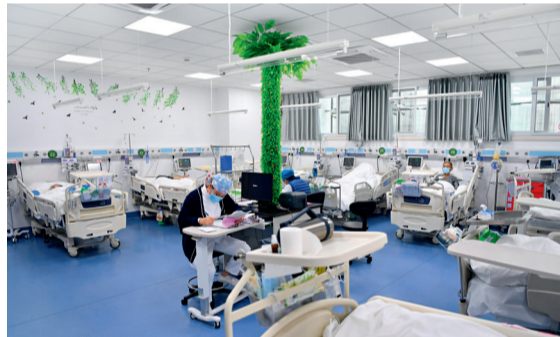
改造后的急诊应急抢救间

（上接3版）建立1小时紧急核酸检测机制。组建检验人员梯队，加强应急演练，坚持平战结合，为应对疫情做好充分准备。