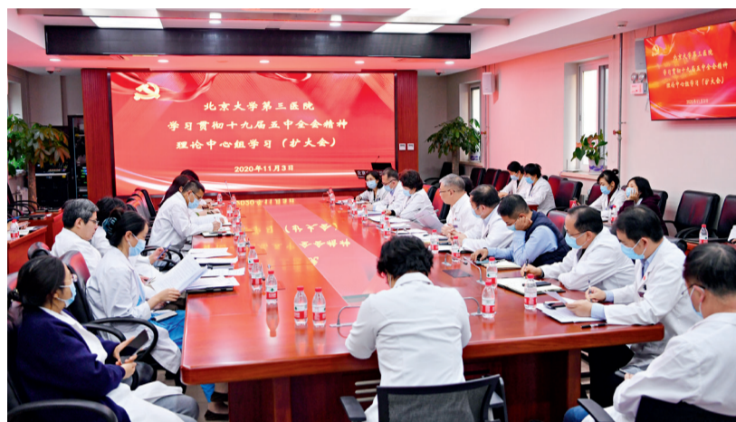
党委理论中心组扩大会议现场