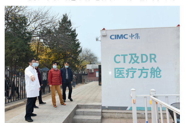
院领导到医疗方舱调研

大力推进新冠病毒检测实验室建设，提升新冠肺炎诊断和排查水平，为院内感控提供重要保障。总务处、医工处、医务处等多个部门对实验室进行改造，改善实验条件，改善工作人员休息环境。检验科不断进行检验人才培养和技术攻关，我院核酸检测水平已大幅提升。为了应对可能发生的疫情，检验科、医务处等部门联合制定核酸检测应急流程，医院成立核酸检测实验室应急响应工作组，将根据不同应急级别，启动相应实验室。（下转4版）