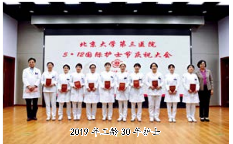
2019 年工龄 30 年护士