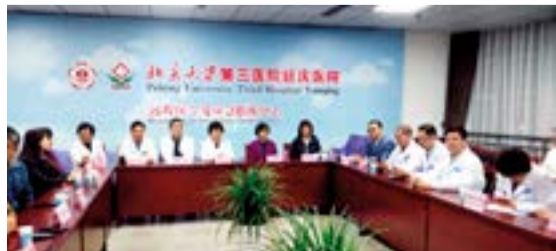
世园会延庆医院远程医学及应急指挥中心

医院对“一带一路”国际合作高峰论坛和“世界园艺博览会”两大盛会的医疗保障工作高度重视，周密部署，安排了医院本部和北医三院延庆医院（延庆区医院）专人负责；本部选派17名政治思想可靠、业务过硬的医护人员与延庆医院组成医疗组，多次梳理应急流程，进行实地演练，确保保障工作万无一失。