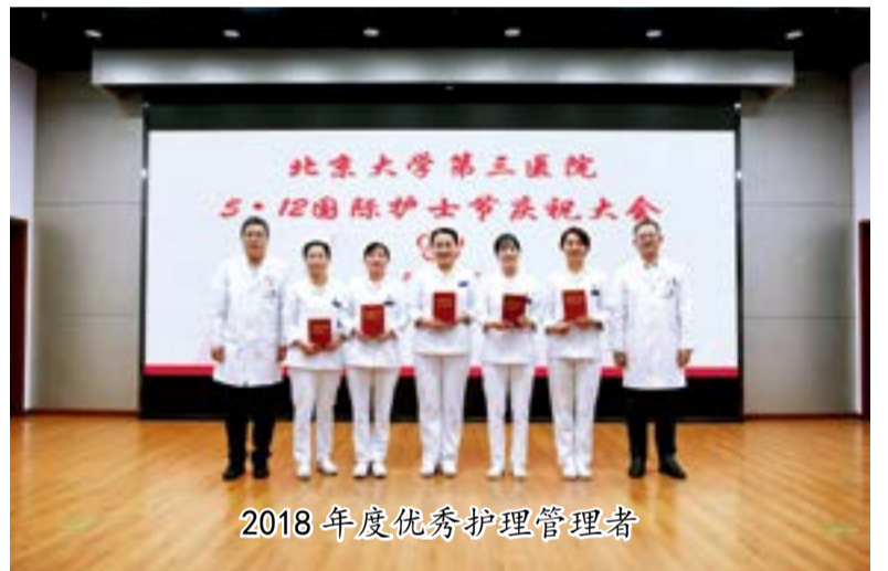
2018 年度优秀护理管理者