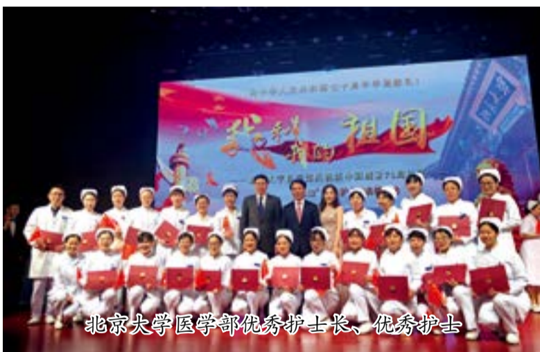
北京大学医学部优秀护士长、优秀护士