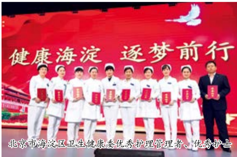
北京市海淀区卫生健康委优秀护理管理者、优秀护士