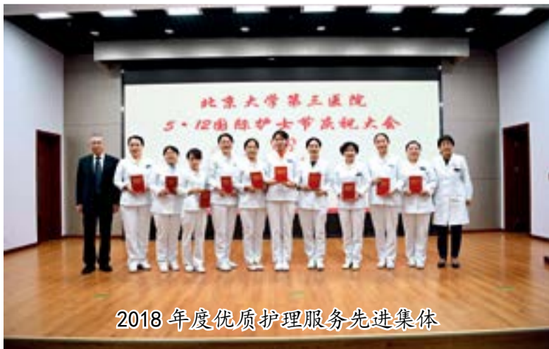
2018 年度优质护理服务先进集体