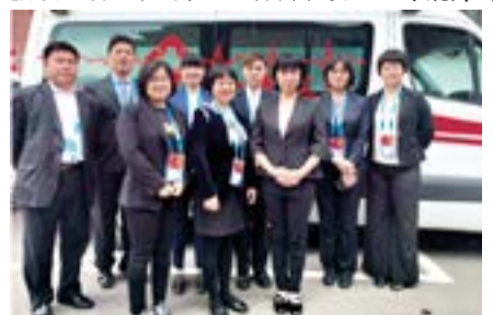
我院“一带一路”医疗保障组全体成员

在整个“一带一路”国际合作高峰论坛和世界园艺博览会开幕式医疗保障服务期间，医疗组人员以高度的政治责任感和精益求精的工作作风，耐心、细致、热情地为代表及工作人员服务，充分展现了医务工作者爱岗敬业、无私奉献的风范及北医三院人的风采，圆满完成了会议的医疗卫生保障任务。