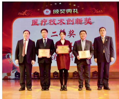
二等奖 普通外科、耳鼻喉科、消化科