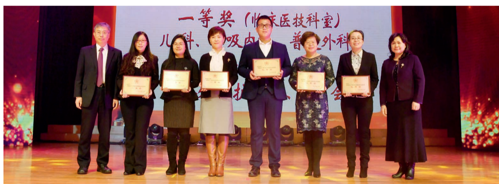
一等奖：儿科、呼吸内科、普通外科