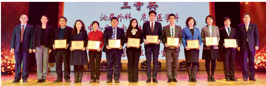
三等奖 泌尿外科、危重医学科、中心实验室、体检中心、儿科、门诊部（两项）、护理部（两项）、经营管理办公室