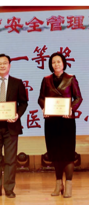
一等奖 生殖医学中心