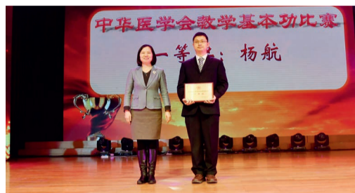
第七届医学(医药)院校青年教师教学基本功比赛一等奖