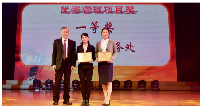
一等奖 药剂科、医务处