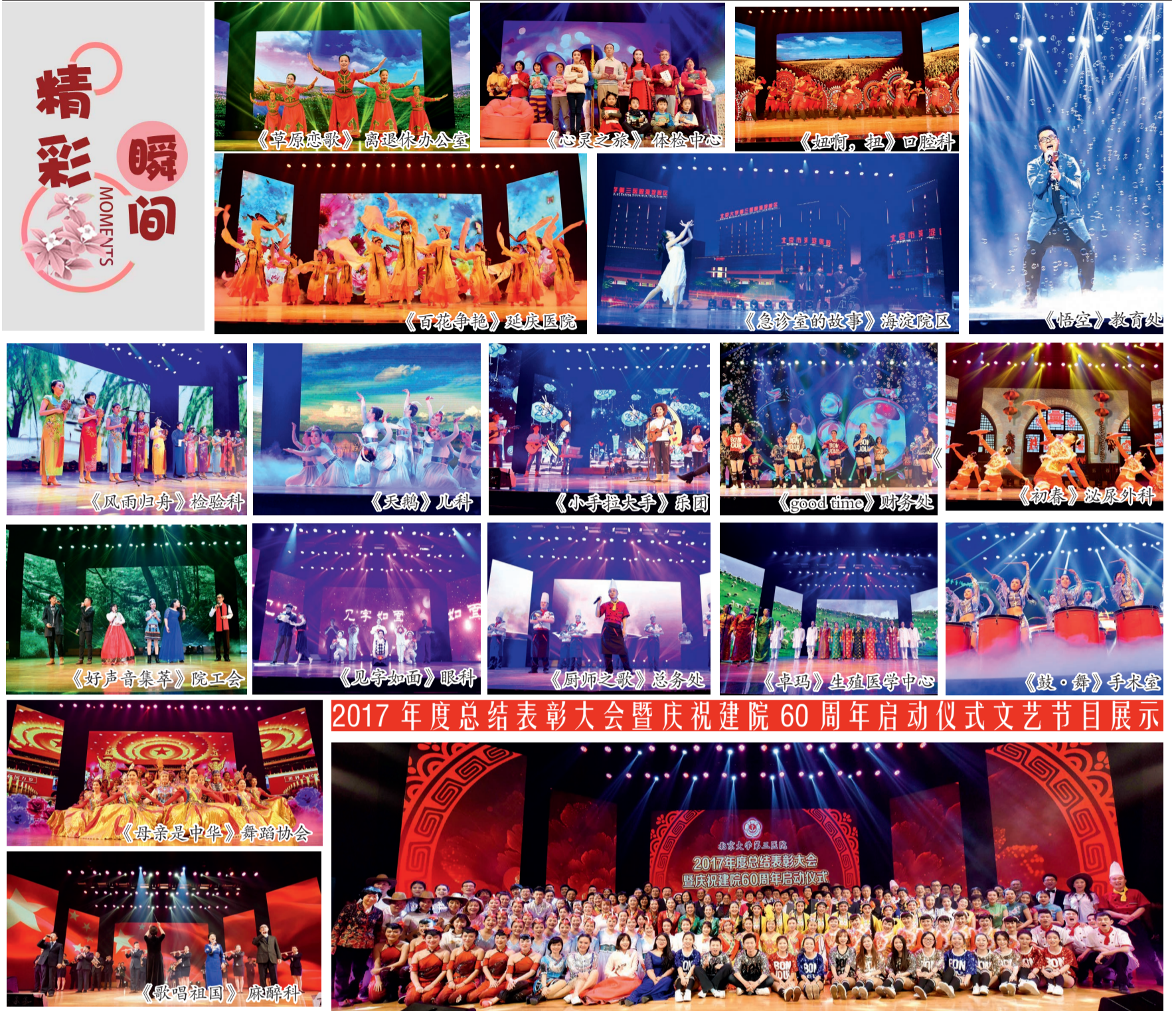
2017年度总结表彰大会暨庆祝建院60周年启动仪式文艺节目展示