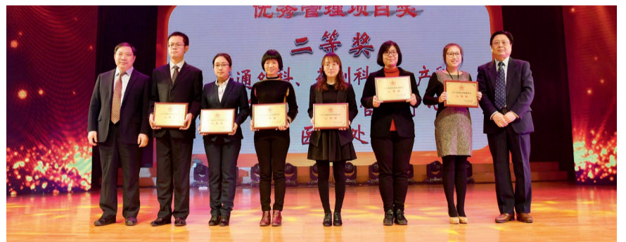
二等奖 普通外科、药剂科、妇产科、总务处、信息中心、医务处