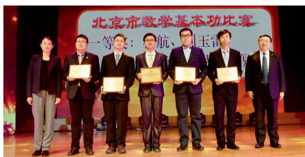
北京高校第十届青年教师教学基本功比赛一等奖