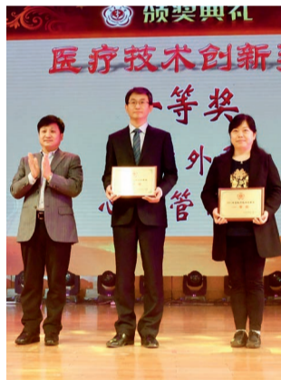
一等奖 心脏外科、心血管内科