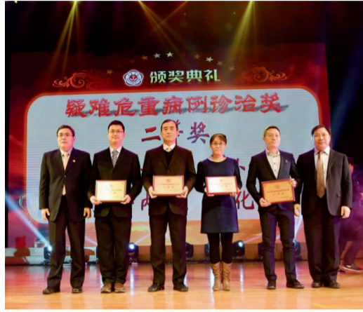
二等奖 心脏外科、胸外科、心血管内科、消化科