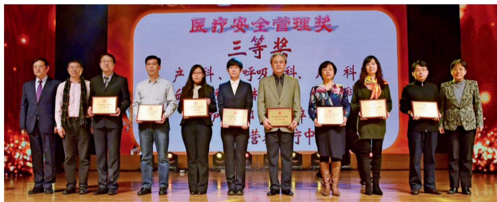
老年内科、妇科、耳鼻喉科、生殖医学中心、产科、儿科、信息中心、门诊部、心血管内科、危重医学科