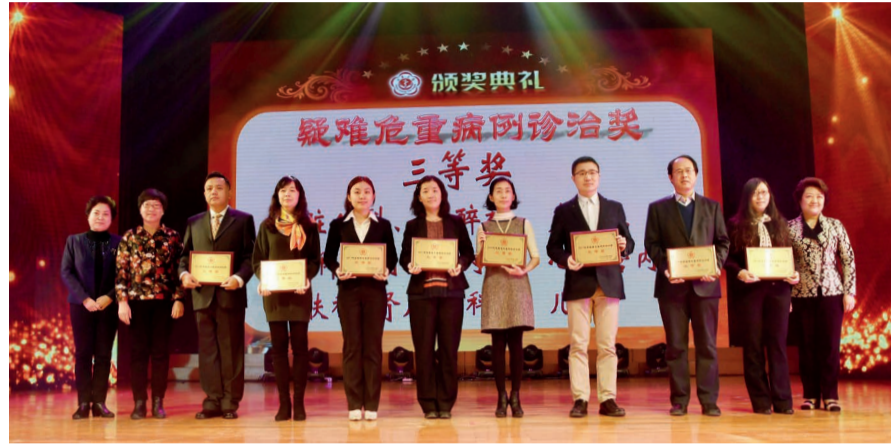
三等奖 心脏外科、麻醉科、产科、妇科、内分泌科、 心血管内科、皮肤科、肾内科、儿科