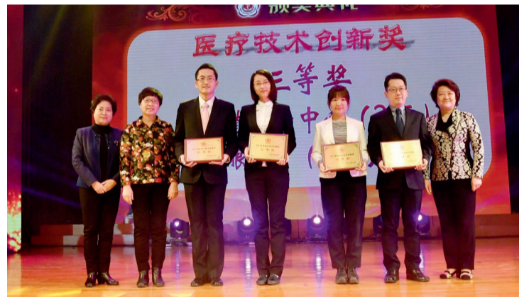
三等奖 生殖医学中心（两项）、眼科（两项）