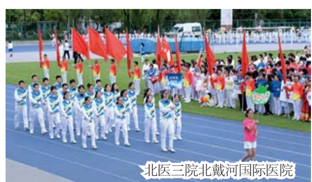
北医三院北戴河国际医院