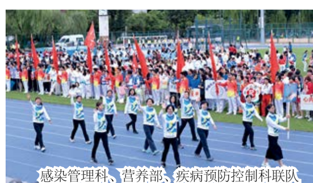
感染管理科、营养部、疾病预防控制科联队