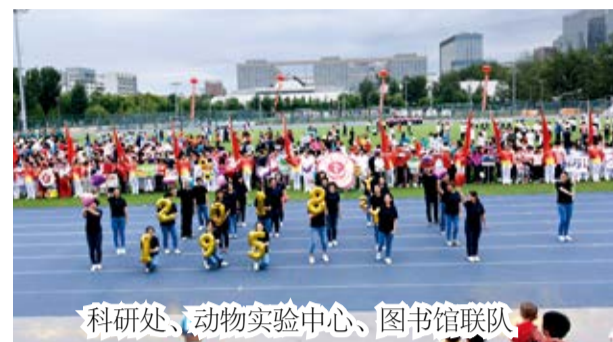
科研处、动物实验中心、图书馆联队