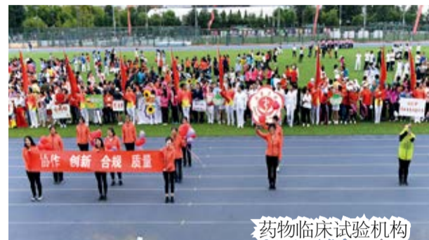
药物临床试验机构