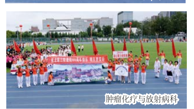
肿瘤化疗与放射病科