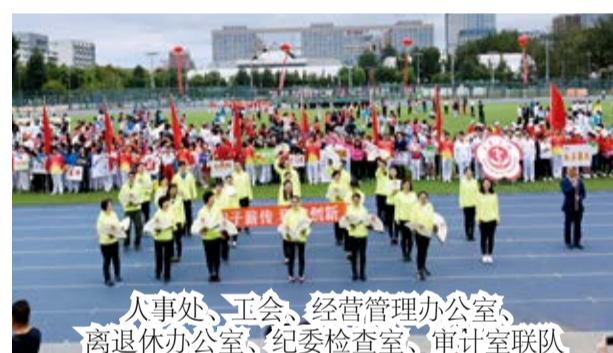
人事处、工会、经营管理办公室、离退休办公室、纪委检查室、审计室联队