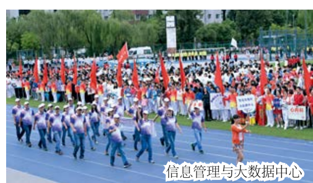
信息管理与大数据中心