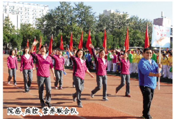
院感、疾控、营养联合队