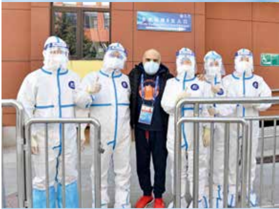
外籍技术官员与救治他的医生合影

2月6日，大年初六，2022北京冬奥会第二个比赛日。北京的天空湛蓝如洗、白云旖旎。