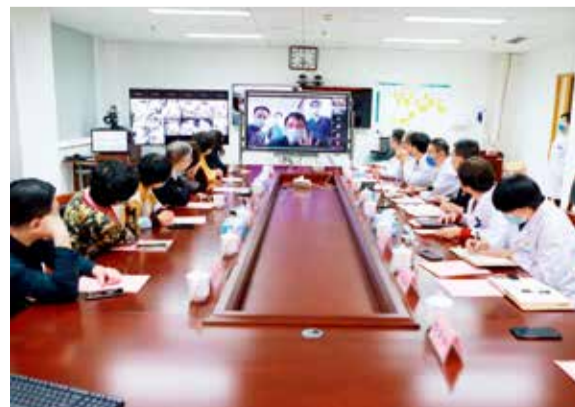
延庆医院冬奥医疗保障调研座谈会现场

“我们一定能够扛起重任,决胜奥运会,用保障冬奥的实际行动,践行总书记重要讲话精神,为各国运动员、随队官员、国际技术官员、场内工作人员提供便捷、高效的医疗服务,圆满完成党和人民交给我们的光荣任务,为精彩、非凡、卓越的冬奥会做出我们北医三院人的贡献。”周方院长说出了北医三院延庆医院冬奥医疗保障团队每一位队员的心声。(下转3版)