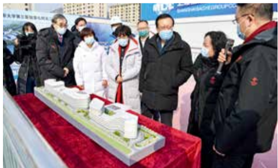
北京大学校长郝平、常务副校长乔杰一行了解国家区域医疗中心二期工程项目建设进展

本报讯 2月9日,北京大学校长郝平,北京大学常务副校长、医学部主任、北京大学第三医院院长乔杰院士一行到北医三院崇礼院区调研院区冬奥医疗保障工作和国家区域医疗中心建设进展,并召开座谈会。河北省卫生健康委党组书记梁占凯、张家口市市长赵文锋出席相关活动。崇礼院区院长敖英芳,张家口崇礼医学中心党委书记张华及院区领导班子陪同调研。