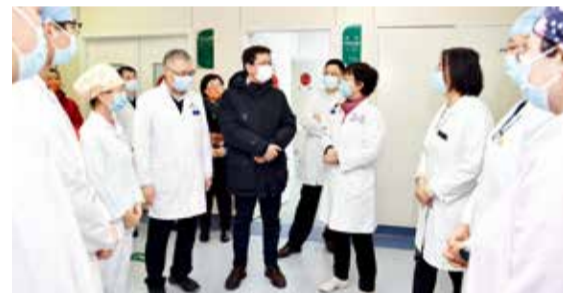
北京市卫生健康委党委书记、副主任钟东波一行来院慰问

随后,钟东波书记一行来到感染疾病中心、核酸筛查门诊,考察北医三院冬奥医疗保障筹备和疫情防控工作。今年的春节不同以往,北京冬奥会开幕在即,作