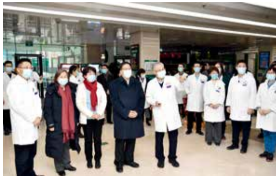
北京大学党委书记邱水平一行慰问北医三院医务人员

本报讯 1月30日下午,在壬寅虎年春节即将来临之际,北京大学党委书记邱水平,北京大学常务副校长、医学部主任、北京大学第三医院院长乔杰,北京大学党委副书记、纪委书记叶静漪等领导一行来到北医三