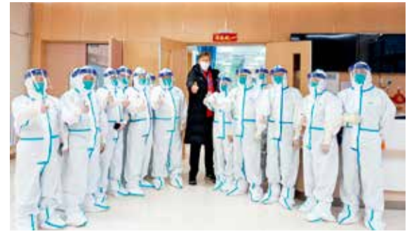
理查德·巴吉特与创伤中心工作人员合影

会和冬残奥会提供高质量、高效率的医疗保障服务，并在后奥运时代以可持续满足区域人民群众高水平医疗服务需求为目标，推动区域医疗资源均衡布局，促进京津冀健康事业协同发展。（张爱丽 蒋艳芳）