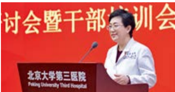
北京大学医学部常务副主任、北医三院院长乔杰院士在会上作报告

乔杰院长以“审势相机 以质图强 迈向十四五 启航新征程”为题作报告。乔院长首先回顾了“十三五”期间医院发展取得的累累硕果,医院整体规模取得突破性进展,各类人员数量明显增加,“十三五”期间医院门诊急诊服务患者超过2000万人次,完成手术治疗32万例次,接待住院患者55万人次。医院新增大批领军人才,人才梯队逐步完善,核心科技领域再创引领。