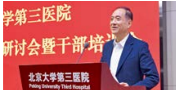
全国政协原副主席韩启德院士在会上发表讲话

韩启德院士感慨:“从1988年3月到三院工作至今,我见证了33年来三院从建筑空间到医疗,从教学到科研,发生了怎样的变化。其中最关键的因素,是医院的文化,是我们三院团结向上的精神面貌。”