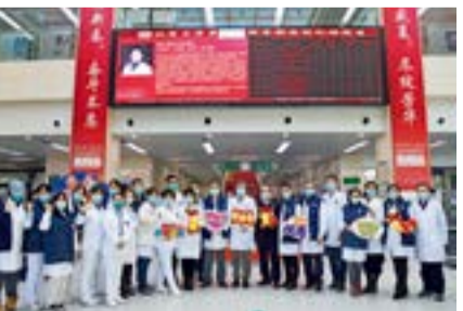
付卫副院长率队来到首都国际机场院区看望慰问一线职工