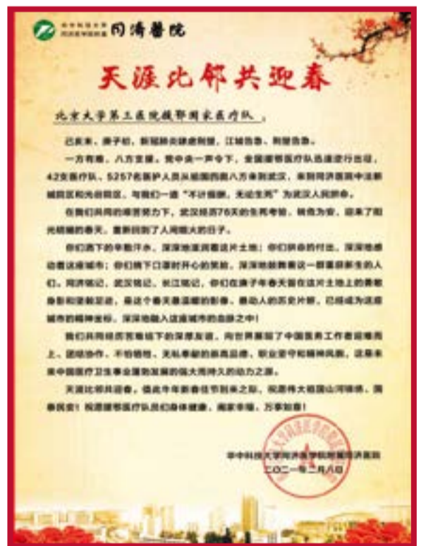
2021年春节前夕,华中科技大学同济医学院附属同济医院向北京大学第三医院援鄂国家医疗队发来感谢信并致以新春的祝福。